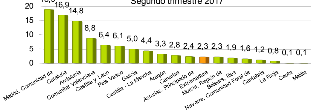
Porcentaje de viajes por Comunidad Autónoma de destino Segundo trimestre 2017