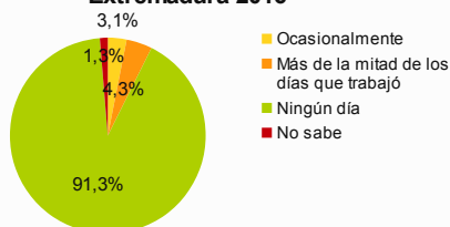
Porcentaje de ocupados por frecuencia con la que trabajan en su domicilio particular Extremadura 2016