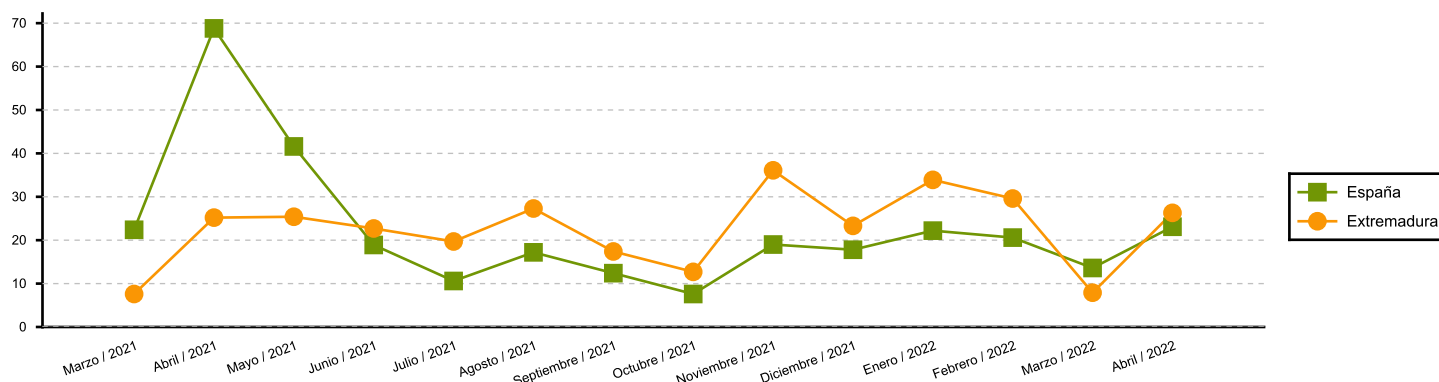
Variación anual del Índice de Cifras de Negocio en la Industria