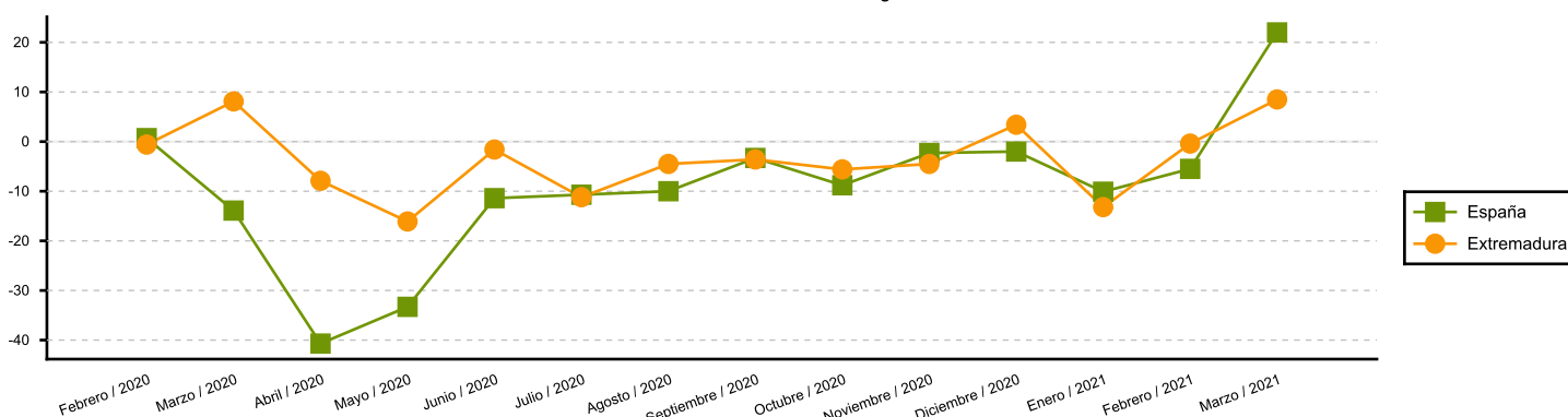
Variación anual del Índice de Cifras de Negocio en la Industria