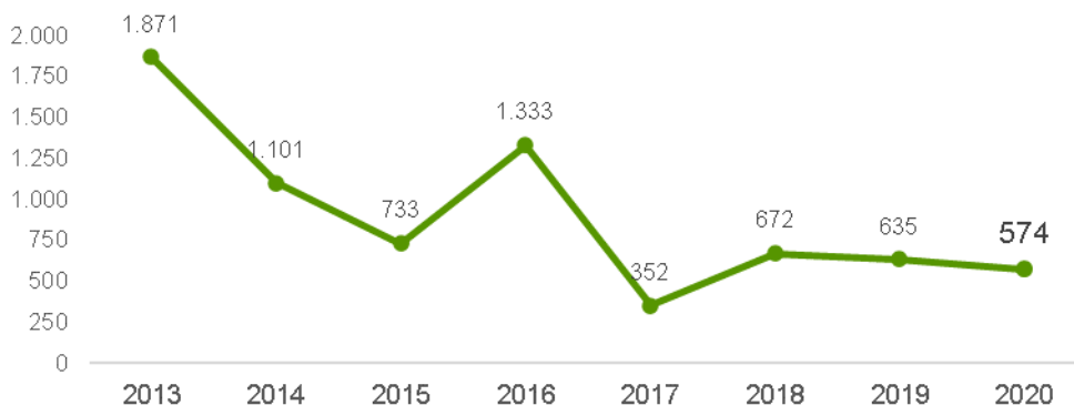
Adquisiciones de nacionalidad española en Extremadura Serie

En la provincia de Cáceres 326 extranjeros adquirieron la nacionalidad española y 248 en la de Badajoz.